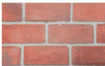
056 Brick Garda