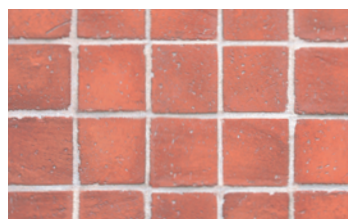
057 Brick Piccoli