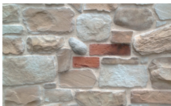
774 Mix Toscana